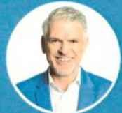
Steffen Vogel, MdL aus Theres